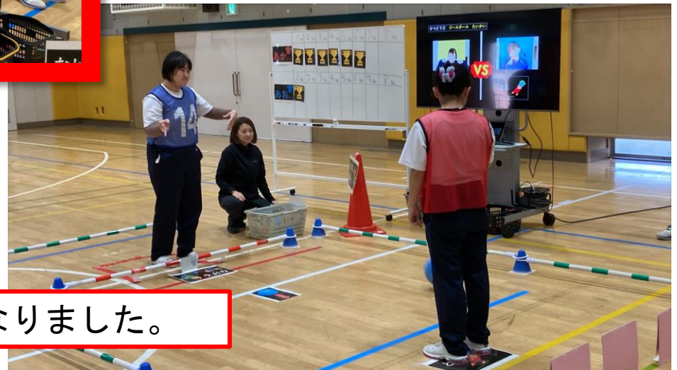
赤・青に分かれて、白熱した試合になりました。