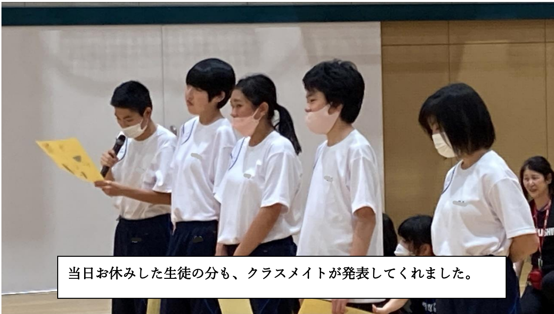
当日お休みした生徒の分も、クラスメイトが発表してくれました。