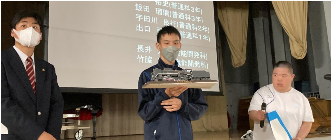
続いて各部活動の紹介と部員勧誘のパフォーマンスがありました。