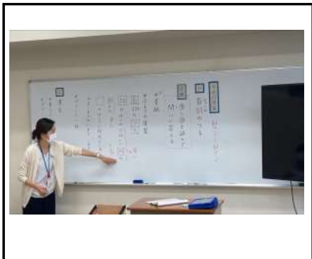
職能開発科 1年国語「文章読解」