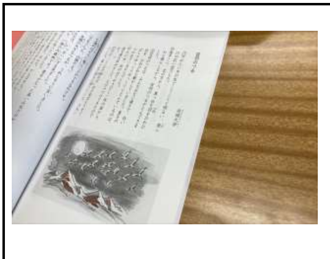
花岡大学の「百羽の鶴」を題材に、物語の内容を確かめながら読み込んでいました。