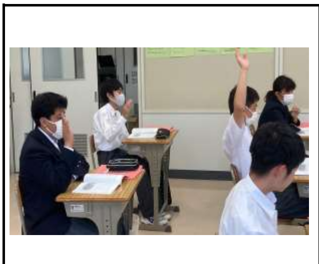
教員からの質問に、しっかり挙手して答えています。 「なんとなく、こうかな？」ではなく、書かれている内容を確認することが大切です。