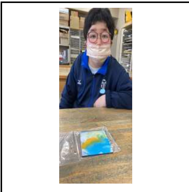
好みの色を置いてみました。さわやかな色を選んでいました。