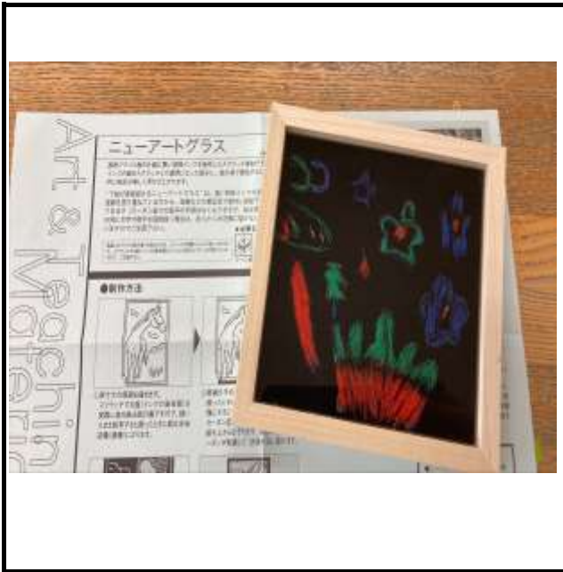
普通科2年の美術の授業です。 単元は「ニューアートグラス」。スクラッチ描画の一種です。