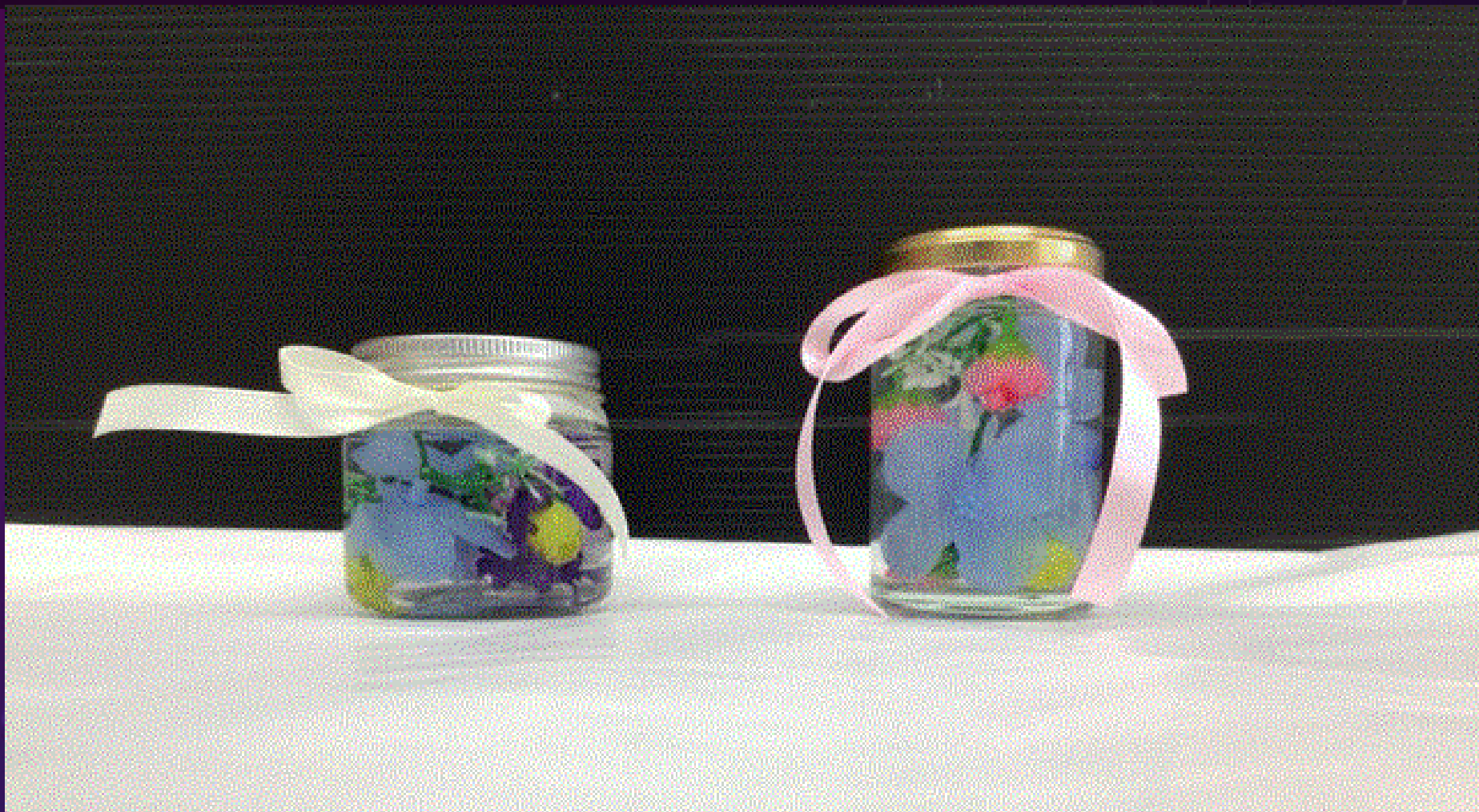
花畑学園 肢体不自由教育部門 中学部3年生 タイトル「ハーバリウム」