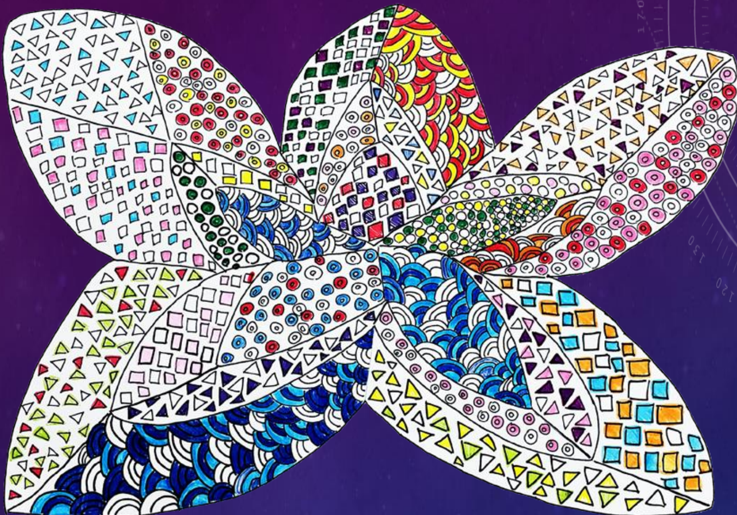
足立特別支援学校 高等部3年 職能開発科 タイトル「大輪の花」