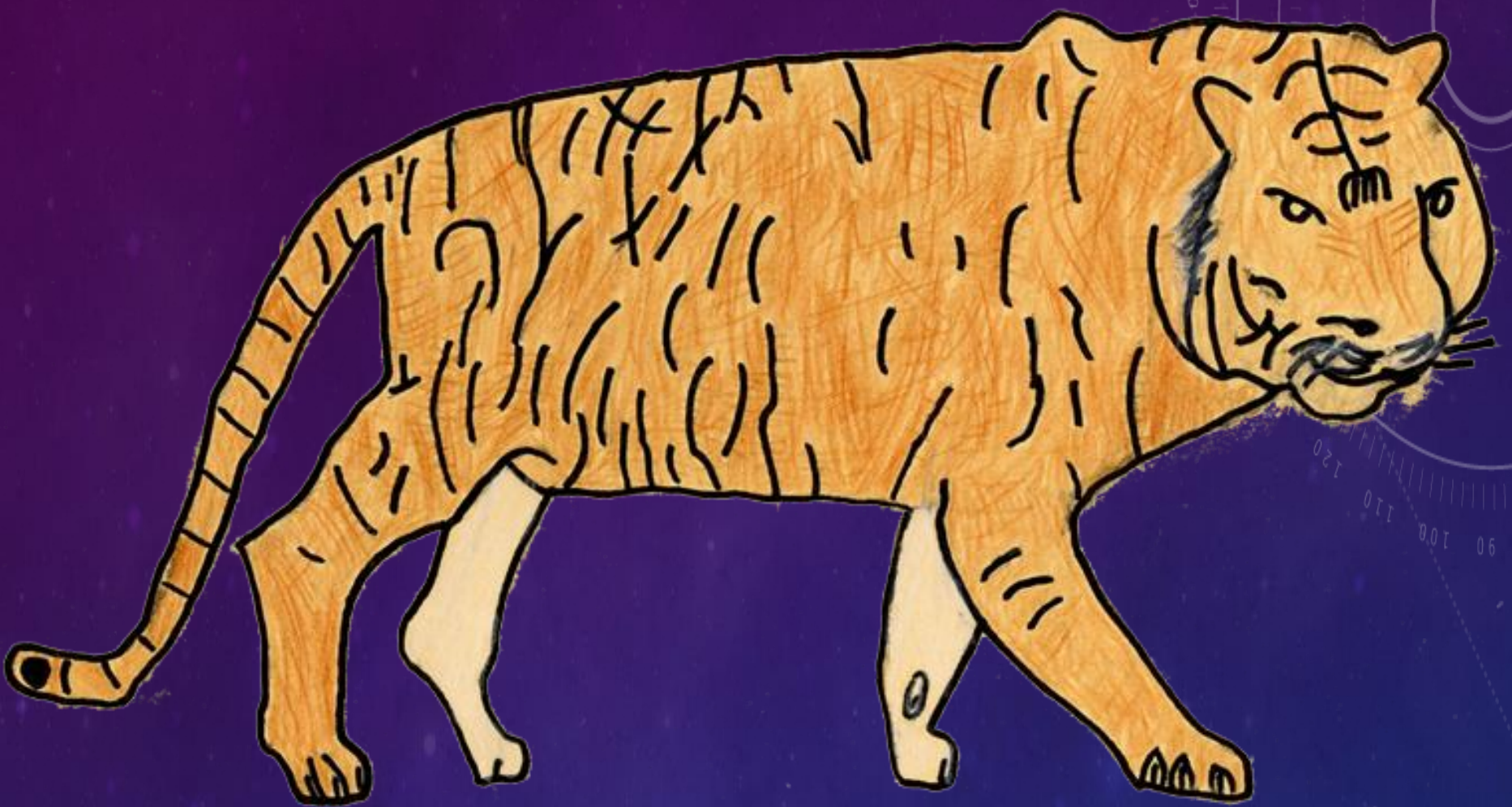
足立特別支援学校 高等部 普通科3年生 タイトル「トラ」