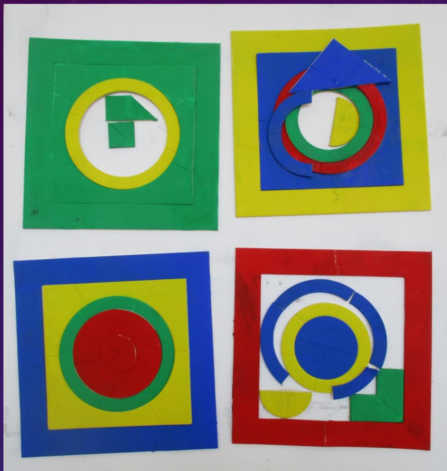
花畑学園 知的障害教育部門 中学部3年生 タイトル「コンポジション」