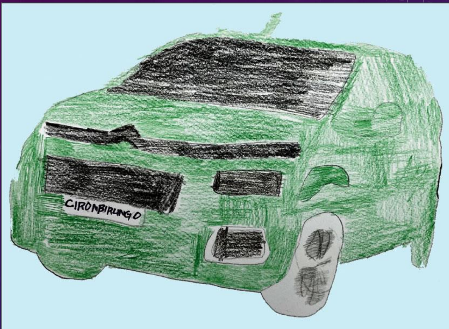
足立特別支援学校 高等部 普通科3年生 タイトル「私の好きな自動車」