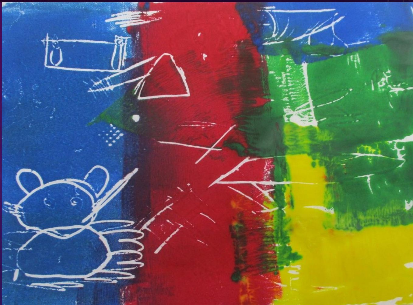
花畑学園 知的障害教育部門 小学部6年生 タイトル「動物園」