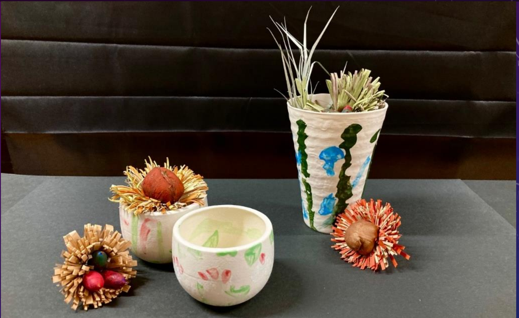
花畑学園 肢体自由教育部門 高等部3年生 でいしょうとうげい タイトル「泥漿陶芸」