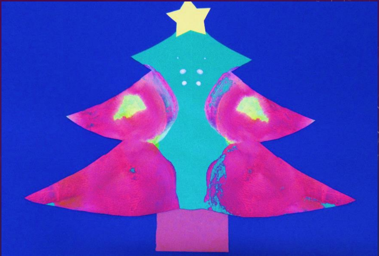
花畑学園 知的障害教育部門 小学部3年生 タイトル「つくったよ クリスマスツリー」