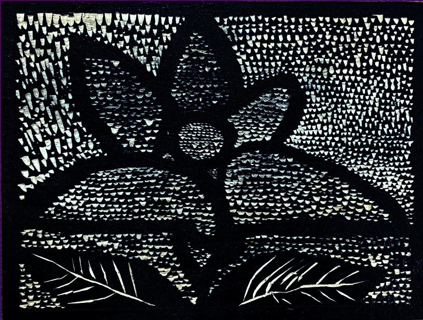
足立特別支援学校 高等部2年 職能開発科 タイトル「レッドエンペラー」