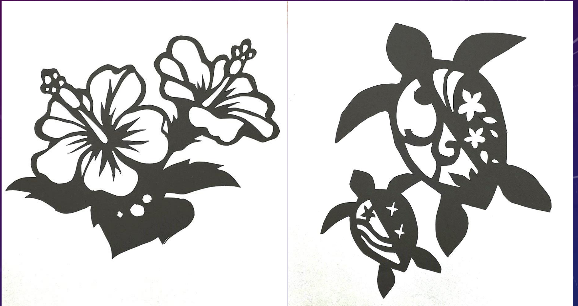
足立特別支援学校 高等部 普通科2年生 タイトル「切り絵」