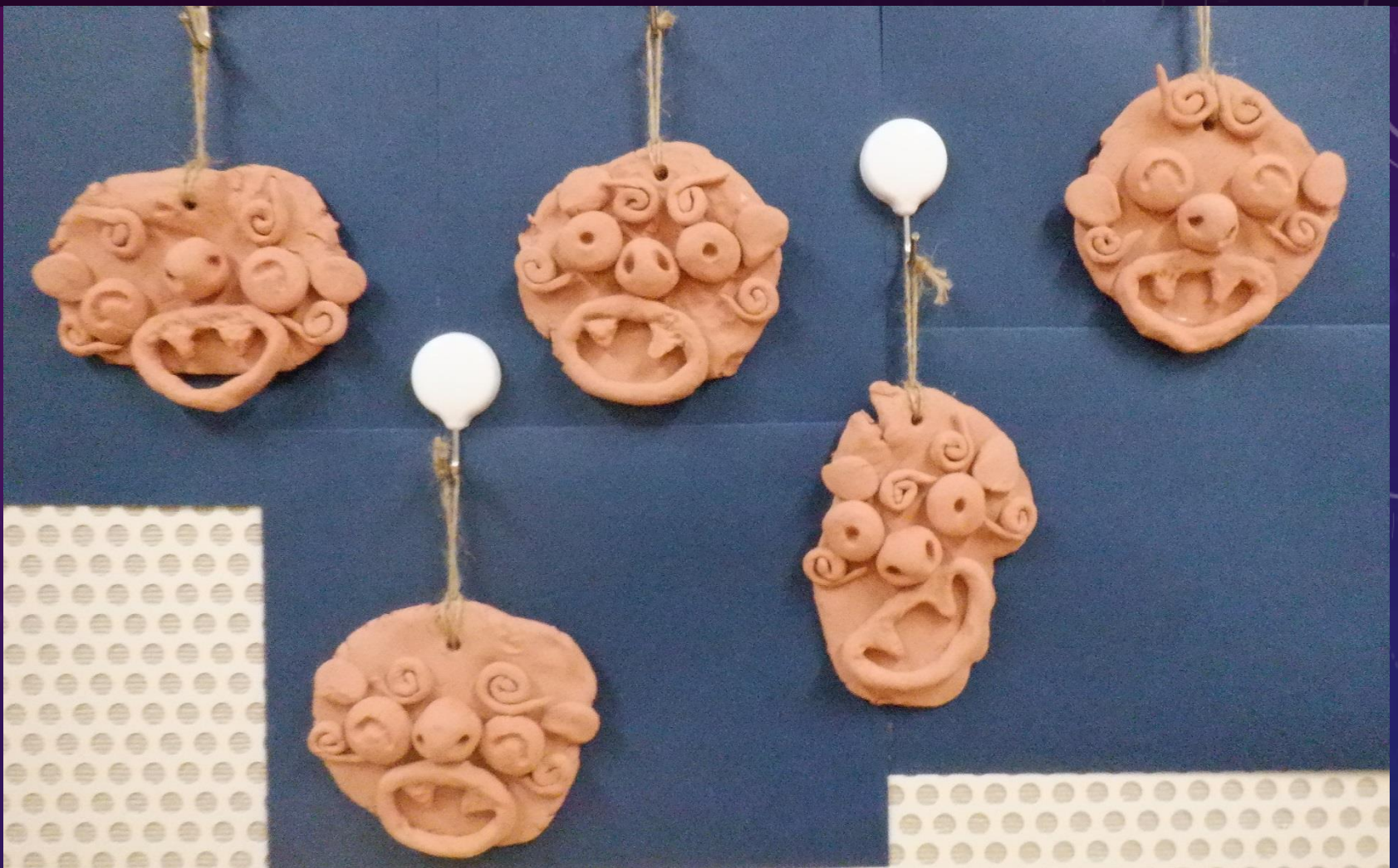
花畑学園 肢体不自由教育部門 小学部6年生 タイトル「シーサー」